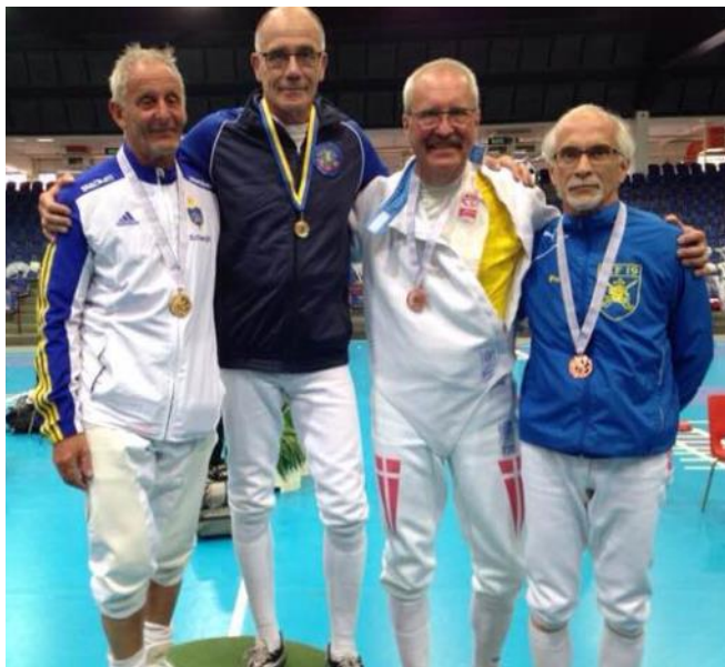
Joop 2e op Ystad international Zweden 2014

Je moet je bedenken dat de KOOS in die tijd 3 afdelingen kende: de tweede, de eerste met 24 schermers inclusief leraren en de Hoofdafdeling met 16 schermers. Ik herinner mij een