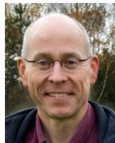
George v Heerde

over het tweede deel van de competitie. Vooral over de laatste 4 maanden viel het deelnemersaantal evenals vorig jaar tegen, redenen voor de afmeldingen waren verhindering door dienstverrichtingen (studie, uitzending) of werk. Van de 43 geklasseerden in het eindklassement zijn er 23 actief -dienend waaronder 11 aspirant officieren van KMA en/of KIM.