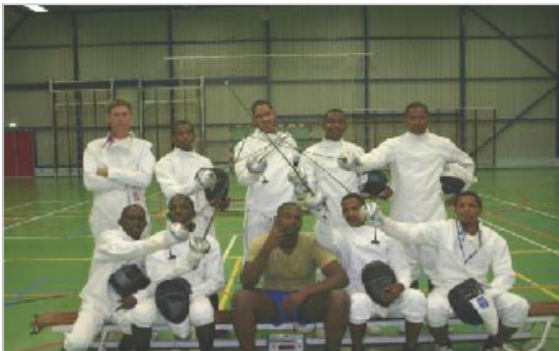
De finalisten van de finale poule. Rechts voor de uiteindelijke winnaar

Het was een niet alledaags gezicht om miliciens van de Antilliaanse militie rond te zien lopen in spierwitte scherm pakken en gewapend met een degen. In het kader van het militaire gedeelte van hun opleiding, waarbij ze te maken krijgen met een velerlei aan sportlessen, waaronder deze keer ook het schermen. De reden hiervoor ligt niet alleen op sportief gebied; maar ook de opvoedkundige waarde en het wederzijds respect wat je een tegenstander moet bieden is iets wat in het kader valt om deze jongens te leren met elkaar samen te werken. Immers bij de scherm sport is het niet alleen maar brute kracht wat tot de overwinning kan leiden. Behendigheid, lenigheid en tactisch inzicht zijn maar een paar facetten die niet gerelateerd zijn aan de fysieke kenmerken van een schermer.