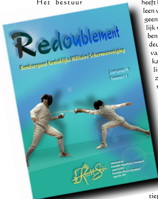
Hans, van harte welkom!

In het licht van het voorgaande komt de vraag op of we een blad als Redoublement nog moeten handhaven. Het kost veel geld, omdat het gedrukt en verzonden moet worden. De informatie staat toch ook al op de site en, als zij snelheid behoeft, gaat zij tevens per e-mail! Inderdaad komt dit onderwerp bij bestuursvergaderingen af en toe op. Het bestuur heeft besloten Redoublement te handhaven, niet alleen voor de enkele tientallen leden en donateurs die geen e-mail-adres hebben opgegeven, maar eigenlijk voor alle leden, om een tastbaar werkje te hebben dat nog echt door de brievenbusgleuf op de deurmat valt en dat je echt in je handen kunt vasthouden en zelfs archiveren of in een boekenkast kunt zetten. Voor de meesten zal de actualiteitswaarde daarvan niet groot zijn; die zaken zijn te vinden op de site of komen (ook) per e-mail. Redoublement wil echter wel een verslag doen dat bewaard kan worden. Ook zal het artikelen (moeten) bevatten die een aanvulling geven op wat in de flitsende communicatiekanalen wordt aangeboden. Zoals stof tot overpeinzen, een woord vooraf door de voorzitter, vergaderstukken voor de Algemene ledenvergadering, in memoriams van overleden leden en alle andere zaken die zich meer lenen, of eveneens lenen, voor een blijvende verslaglegging. Het is buitengewoon verheugend dat onze webmaster zich bereid heeft verklaard ook de redacties van Redoublement te gaan voeren: