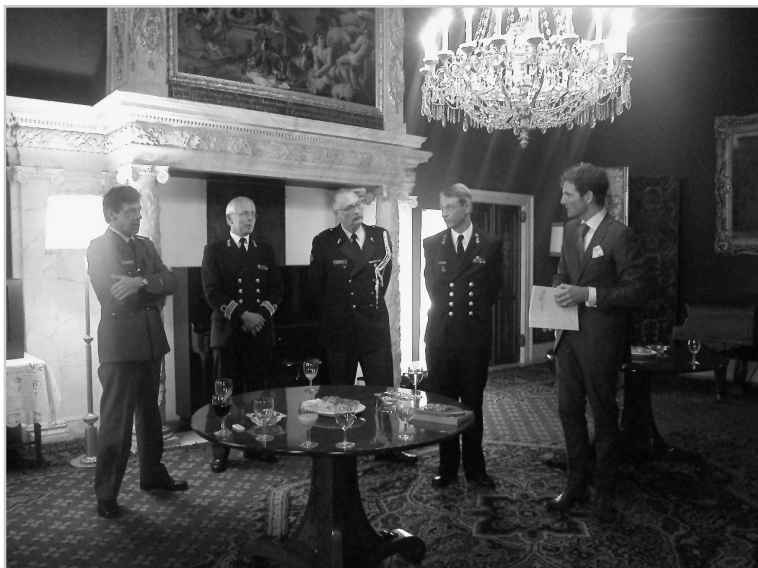
De nieuwe beschermheer met een deel van het bestuur in de ontvangstruimte van het Paleis op de Dam.

En marge van het bezoek mochten wij ook, onder deskundige leiding, een aantal zalen van het Paleis bezichtigen. Dat was zeer de moeite waard. Mocht u gelegenheid hebben dan moet u dit monumentale pand echt gaan bekijken. Het is open voor publiek.