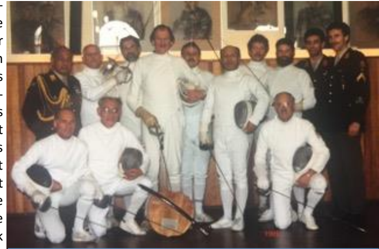
Foto van de Bronbeek klewang in 1989

Gedurende de gehele 19e eeuw vonden daar koloniale acties en oorlogen plaats waarbij de Nederlandse troepen, als het op een gevecht met blanke wapens aan kwam, vaak het onderspit dolven. Dat lag niet alleen de te lange en te zware wapens maar ook aan de relatieve ongeïfendheid van de